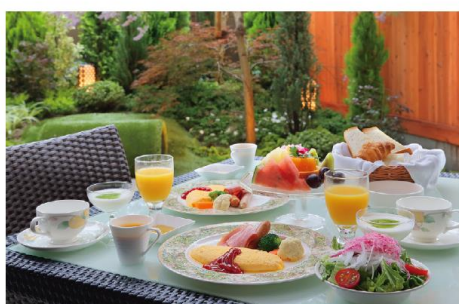
食事は基本1泊朝食となっている。朝食は愛犬と一緒に楽しむルームサービスで和食または洋食を選択

気候が温暖で過ごしやすい南房総にある宿。5タイプの部屋はいずれも広さが60㎡以上あり、床は愛犬にやさしい平織仕上げの専用素材を使用している。全室に備わるコンサバトリールームはダイニングや愛犬の広めの部屋として使えるユニティリティ空間だ。ワンちゃんも遊べるプライベートガーデンや自家源泉を引いた温泉露天エアプロバースも備えている。夕食は、隣接の鴨川館で会席料理や