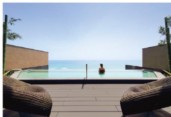
隣接する鴨川館の「HARUKA」は目前に広がる太平洋と一体になる感覚が新しい