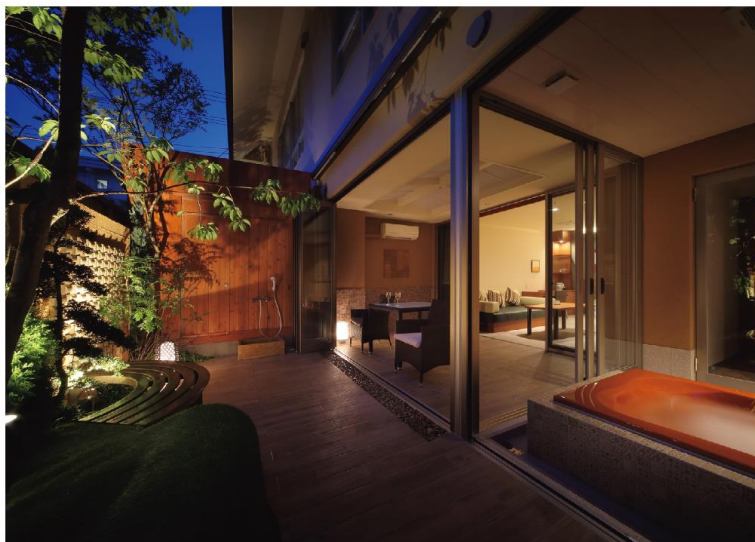
シックで落ち着いた感じられるスーペリアツイン「鹿の子」