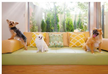
広い室内でワンちゃんたちもゆったり過ごすことができる