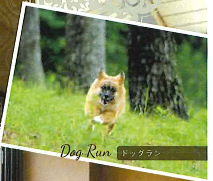
Dog Run ドッグラン